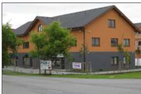
Budova lékařského domu.

Červená tečkovaná čára znázorňuje ideální trasu pro pěší s ohledem na aktuální stav chodníků.