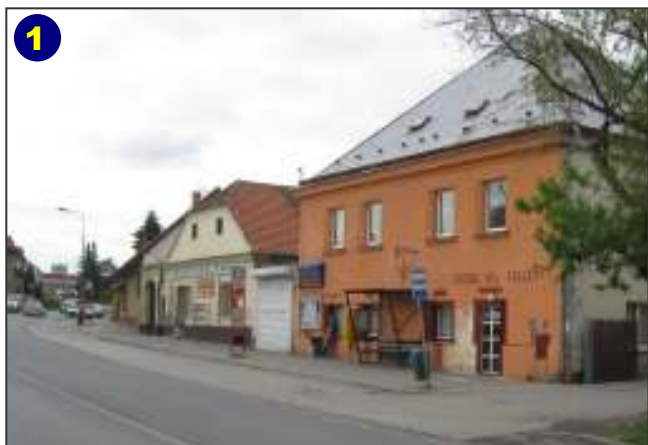
1 Zastávka autobusů 332, 335, 337, 339 a 326 v centru Jesenice - příjezd od Prahy.