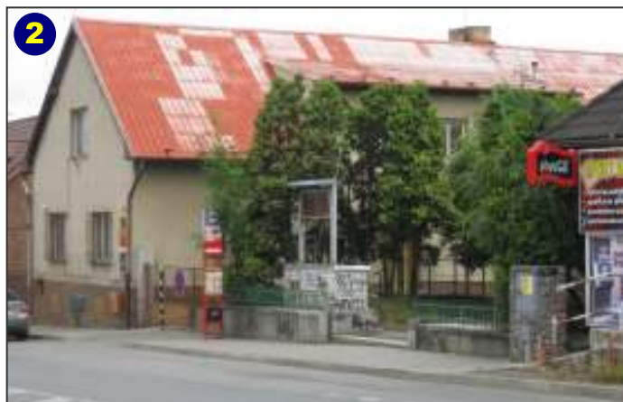
2 Zastávka autobusů 332, 335, 337, 339, 334 a 428 v centru Jesenice - příjezd od Benešova, Říčana a Jilovéhoho.